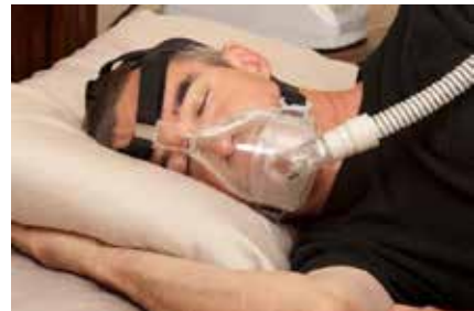
图 1 患有睡眠呼吸暂停的患者和 CPAP 呼吸机面罩

这种称为 CPAP（持续气道正压通气）的呼吸设备也叫 CPAP 呼吸机，它在上述情况下可以提供很大的帮助。该设备通过一个面罩连接到患者（见图 1），在睡眠期间提供微小的正气压，其工作原理如图 2 所示。该设备可以提供确定的空气流量，同时可以保持空气的温度和湿度，用来辅助患有睡眠呼吸暂停疾病的病人呼吸。