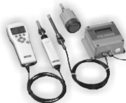
VAISALA 温湿度变送器 露点变送器 精密露点仪 二氧化碳变送器 气象变送器