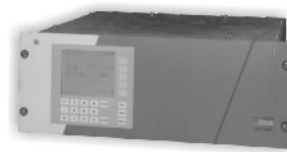
烟气分析仪 多组份气体分析 应用：烟道尾气 垃圾填埋