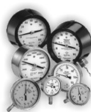
ASHCROFT 1279压力表 双金属温度计 压力开关，温度开关 化学隔离膜片