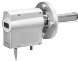
OMT355激光氧气分析仪 测量范围：0-100% 精度：0.2% 应用：制氧机，氮气吹扫 替代顺磁式氧分析仪