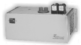
取样系统 设计取样系统 冷凝器，取样器 气泵，过滤器