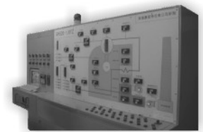
自动化控制工程 传动控制，空调系统，锅炉系统， 节能工程，动力监控，水处理， 盘柜生产 电机控制中心，操作台， 仪表柜，分析柜，接线箱

珠海赛思特仪表设备有限公司是集开发，生产，代理，系统工程一体的综合实体。我公司生产的产品：SI910压力变送器，SI600投入式液位变送器，温度变送器，电气转换器。代理产品：芬兰VAISALA露点仪，温湿度变送器，二氧化碳分析仪，大气压变送器。美国NTRON氧化锆氧气分析仪3100，HITECH电化学氧气分析仪，顺磁式氧气分析仪，便携式氧气分析仪，氢气分析仪，Flowline超声波液位计，最小量程0-1.2米，超声波液位开关，浮球液位开关。Bellofram电气转换器。同时我公司为Honeywell，西门子系统集成商。