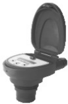
FLOWLINE LIQUID INTELLIGENCE 超声波液位计 型号：LU05/12/11/13/14 超声波液位开关 超声波流量开关